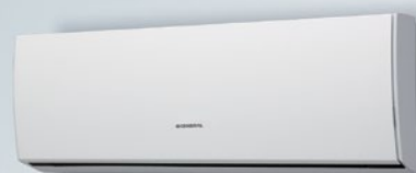
ASHAG09LUCA / ASHAG12LUCA / ASHAG14LUCA

Red dot design award er en internasjonal designkonkurranse rettet mot alle som ønsker å differensiere sin virksomhet gjennom design.